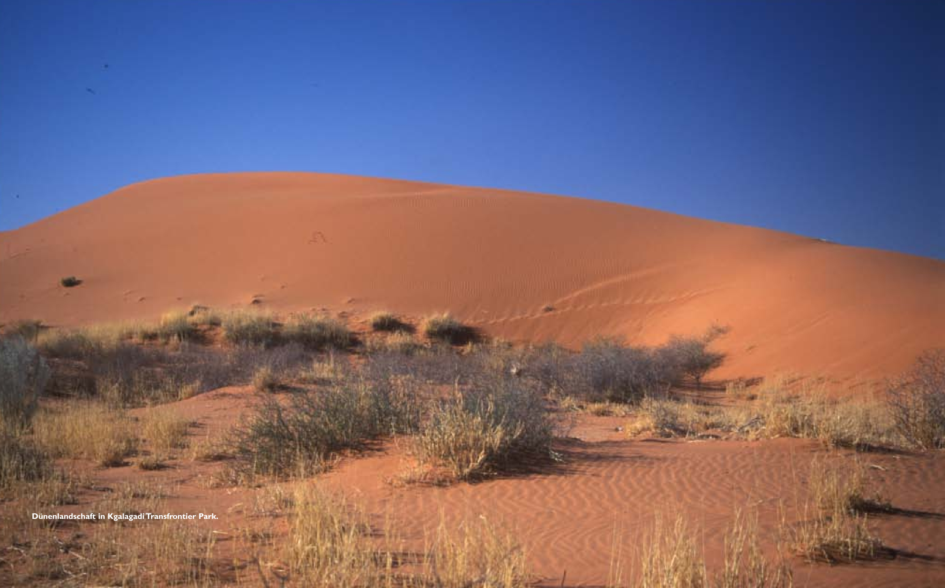
Dünenlandschaft in Kgalagadi Transfrontier Park.