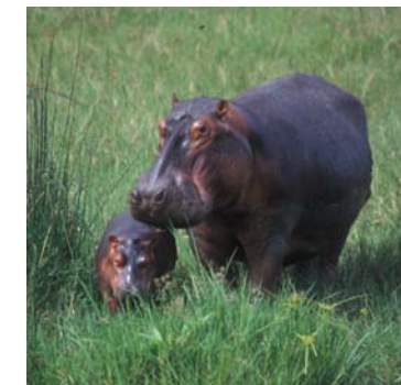
Büffelherde im Hluhluwe/Umfolozi-Reservat (großes Bild) – Seevögel an der Küste (links unten), Flusspferd mit Jungem (links). »Bellende Zebras« (unten).