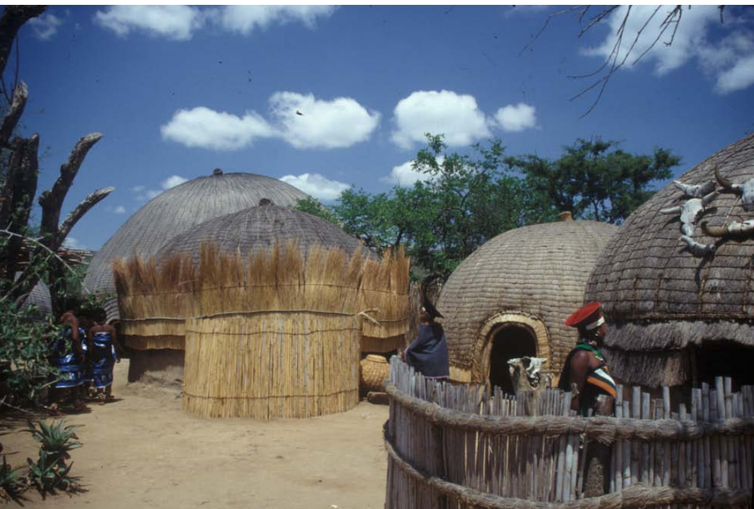
Kupperförmig sind die Hütten in den Zulu-Dörfern (oben). – Einige Vertreterinnen der »Regenbogennation«: Himba-Frau (ganz oben),