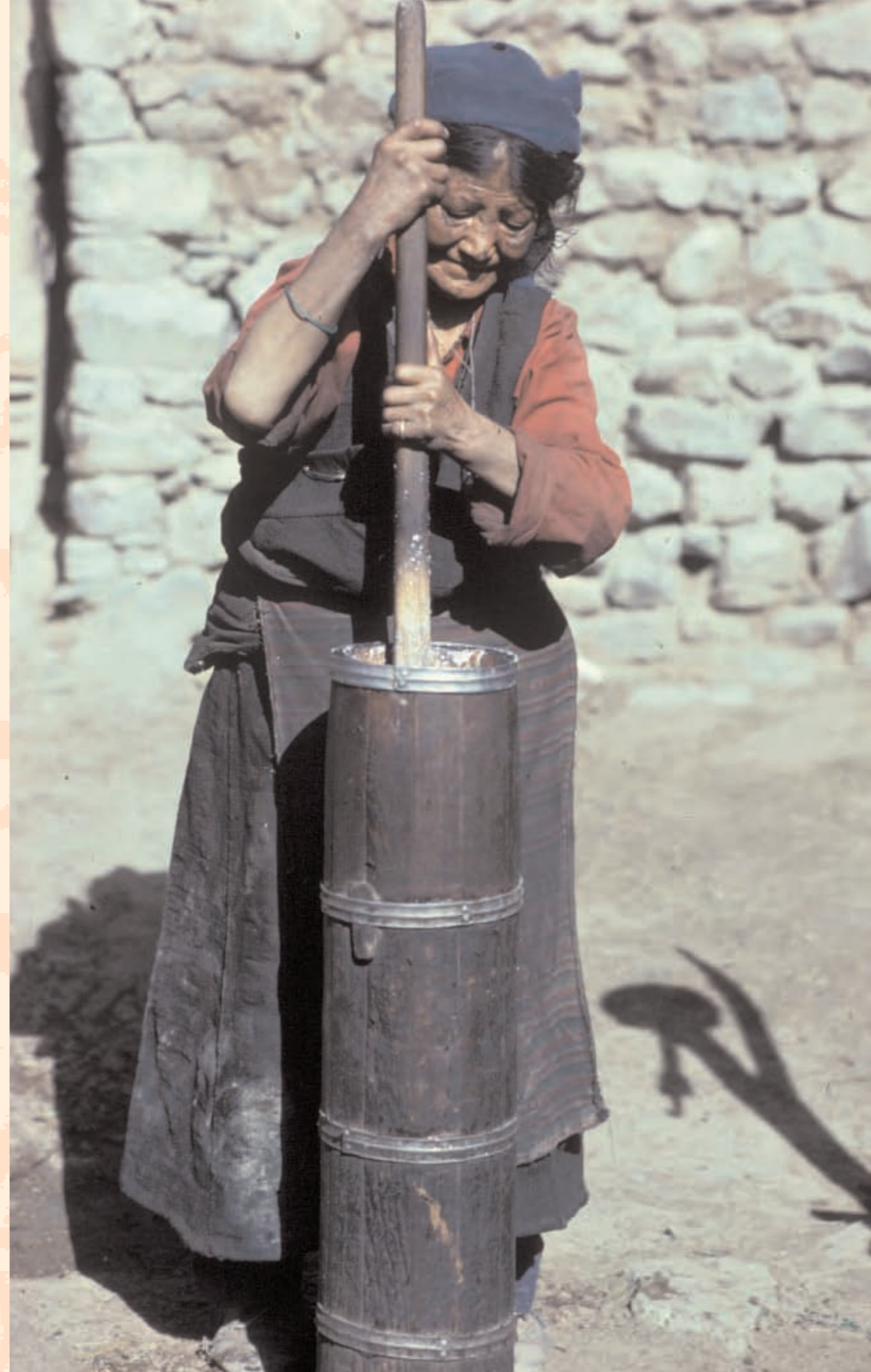
Tibeterin beim Buttern.

4 Kartoffeln, geschält 1 EL Öl 1 große rote Zwiebel, gehackt Salz nach Belieben 100 g Schweizerkäse oder Feta Tomaten, gehackt, nach Belieben 200 ml Wasser 1/2 TL Chilipulver