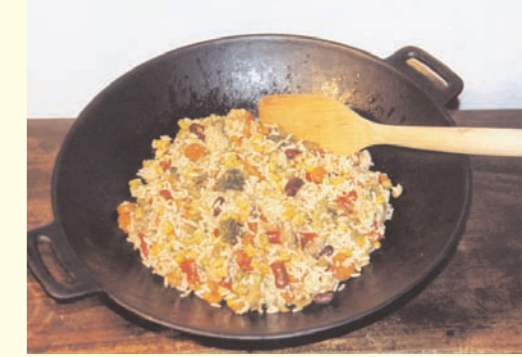
Thugpa Ngopa - Gebratener Reis.

Das Öl erhitzen und Zwiebeln, Ingwer und Knoblauch darin anbraten. Erbsen, Karotten und weiteres Gemüse zugeben und unter ständigem Rühren anschmoren. Jetzt den Reis zugeben und unterrühren, anschließend alles anbraten. Salz und Sojasauce zugeben und alles gleichmäßig mischen. Sofort servieren. Eventuell noch mit Pfeffer und Chilipulver abschmecken.