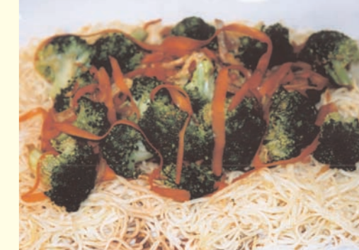
Thugpa Ngopa - Gebratene Nudeln.

Die Nudeln entsprechend der Anleitung in kochendem Salzwasser garen. Öl in einem Wok stark erhitzen. Nudeln und eine Hälfte der Frühlingszwiebeln unterrühren und anbraten. Eventuell in mehreren Portionen. Dann zur Seite stellen. Das Öl im Wok erhitzen und die übrigen Frühlingszwiebeln und restlichen Zutaten ca. 2-3 Minuten unter Rühren garen. Das Ganze über die gebratenen Nudeln gießen.