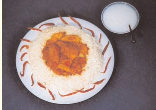
Shogok Khase - Tibetisches Kartoffelcurry.