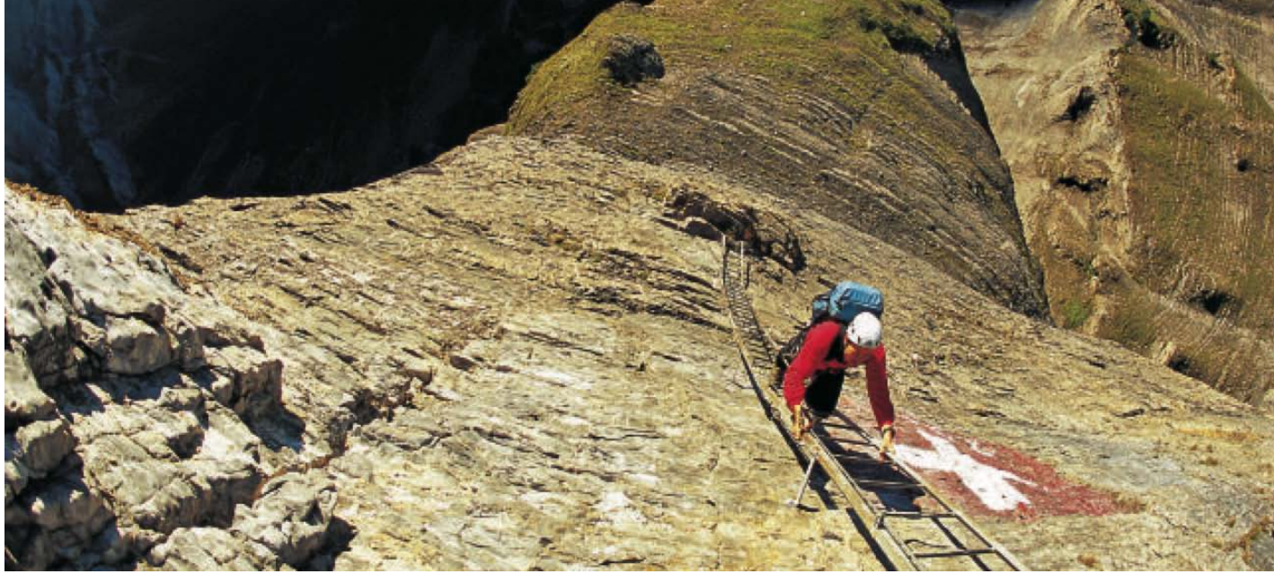
Extrem lange und steile Leitern erfordern sehr viel Kraft und Ausdauer in den Oberarmen.

Ein fantastisches Gefühl! Entspannung pur, du liegst in warmem Mineralwasser, sprudelndem acqua calda, und über der Therme wölbt sich tiefblauer Himmel: Leukerbad am Tag danach. Seit fünfhundert Jahren wird hier gebadet, wegen der Gesundheit vor allem, »in disem tal ligt zu hinderist an der Gemmi / ein meyl von Leuck / das kostlich und heilsam warm Bad / Aquae Leucinae / dz Leuckerbad. Sein wasser ist so heiß / das man hüner darin brühen und eyer siede mag«.