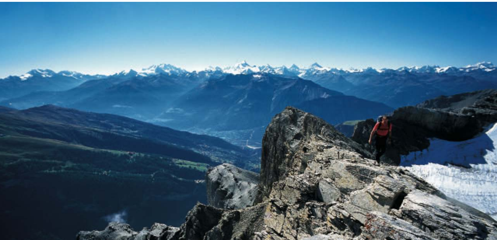
Oben: Am Gipfelgrat öffnet sich das volle Panorama auf all die Viertausender zwischen Fletschhorn und Grand Combin.

Eine letzte Leiter, nochmals Sprosse über Sprosse und dann: Tiefe rundum – du hast es geschafft, gratuliere!