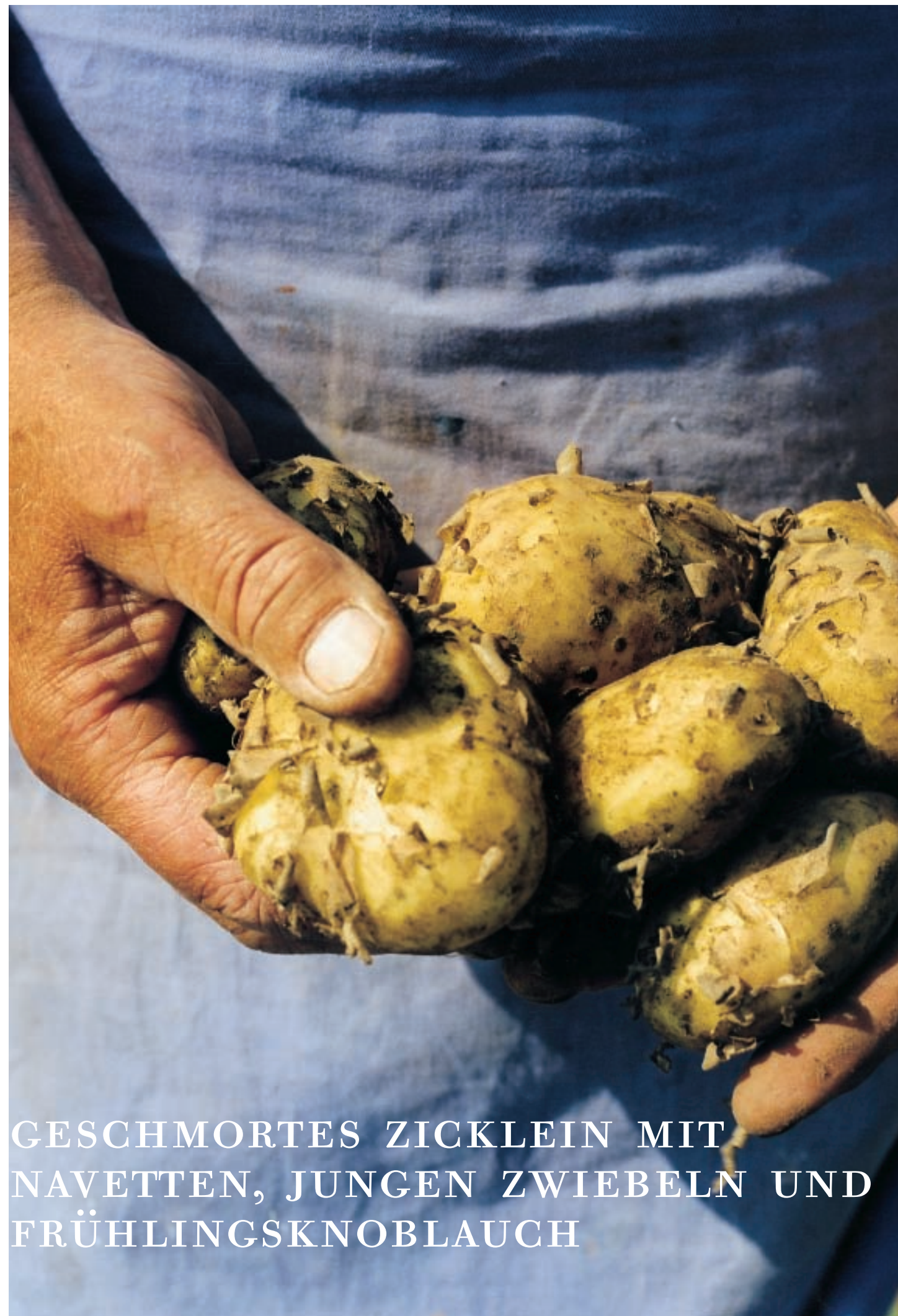
GESCHMORTES ZICKLEIN MIT NAVETTEN, JUNGEN ZWIEBELN UND FRÜHLINGSKNOBLAUCH